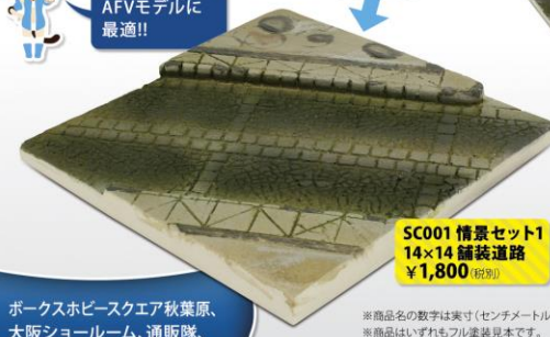
SC001 情景セット1 14×14 舗装道路 ¥1,800 (税別)