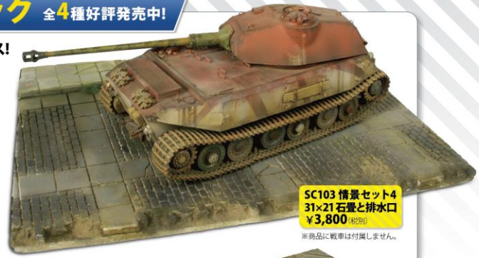
SC103 情景セット4 31×21 石畳と排水口 ¥3,800 (税別) ※商品に戦車は付属しません。