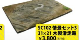
SC102 情景セット3 31×21 木製滑走路 ¥3,800 (税別)