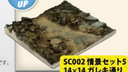
SC002 情景セット5 14×14 ガレキ通り ¥1,800 (税別)