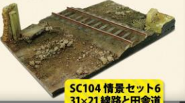
SC104 情景セット6 31×21 線路と田舎道 ¥3,800 (税別)

ボックスホビースクエア秋葉原、大阪ショールーム、通販隊、ホビー天国ウェブのみで発売